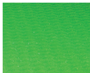
Bugnato Dryfill micromassaggiante a zone