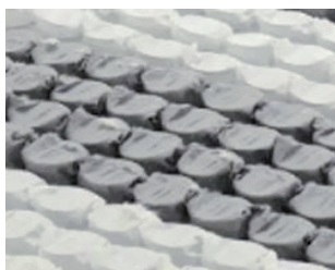
Molle insacchettate a 7 zone

Perimetro realizzato con esclusivi piantoni indeformabili ad alta portanza. La struttura a box evita il contatto diretto con le molle e isola il materasso dai campi magnetici, rendendo il sonno più salutare e rilassante.